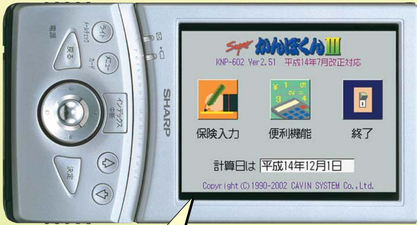
※画面はハメコミ合成です。シャープザウルスMI-E21との組み合わせ例